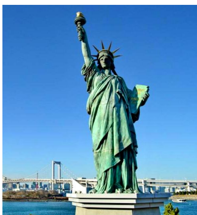
США. Статуя «Свободы»

Сколько лет США: 2018 - 1776 = 242 года. Всего лишь навсего. Где выстраданный опыт, где возраст и позитивный ум, где приобретённые порядочность и честность? Маловато... А гонору то и спеси... Ух, ты сколько его.