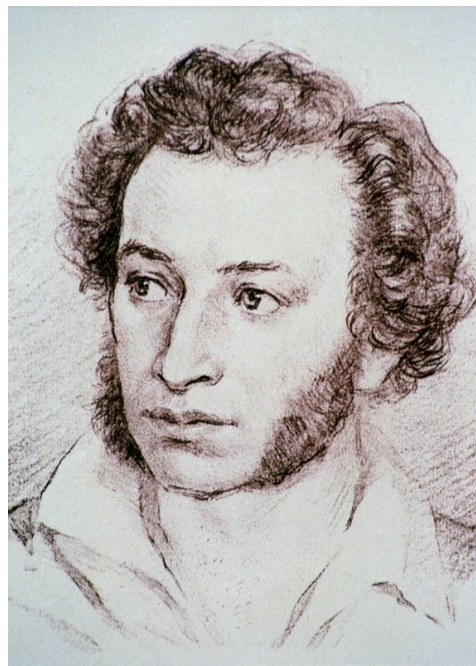
Фото. М.Ю. Лермонтов

Сижу за решеткой в темнице сырой. Вскормленный в неволе орел молодой, Мой грустный товарищ, махая крылом, Кровавую пищу клюет под окном, Клюет, и бросает, и смотрит в окно, Как будто со мною задумал одно. Зовет меня взглядом и криком своим И вымолвить хочет: «Давай улетим! Мы вольные птицы; пора, брат, пора! Туда, где за тучей белеет гора, Туда, где синеют морские края, Туда, где гуляем лишь ветер... да я!...»