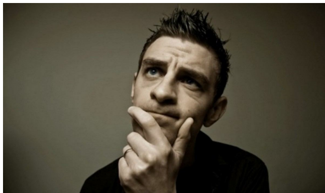
Фото. Мужчина решает научную проблему