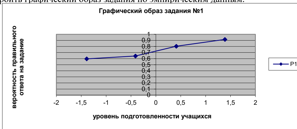
Рисунок 2 – Графический образ задания №1

В соответствии с положениями, принятыми в теории педагогических измерений, полученный коэффициент свидетельствует о наличии у задания системных свойств, присущих для тестового задания. Это дает нам основание к проведению дальнейших вычислений для определения остальных показателей качества задания. Теперь можно построить графический образ задания по эмпирическим данным.