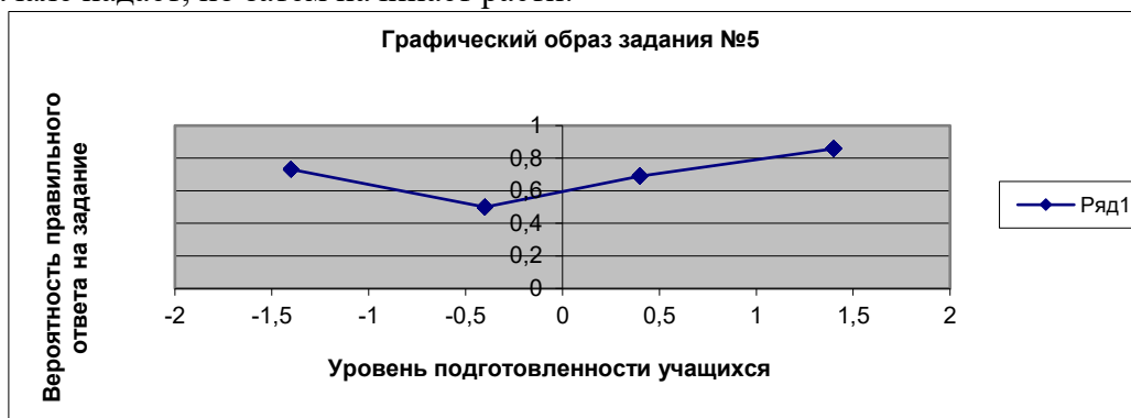
Рисунок 4 – Графический образ задания №5

В нашем случае r_{xy} \approx 0,1 . Это означает, что данное задание не может быть включено в тест и называться тестовым. Для наглядного подтверждения данного утверждения мы воспользовались математической моделью G.Rasch и построили графический образ задания (рис.4). Из которого видно, что по мере роста уровня подготовленности испытуемых вероятность правильного ответа у них странным образом вначале падает, но затем начинает расти.