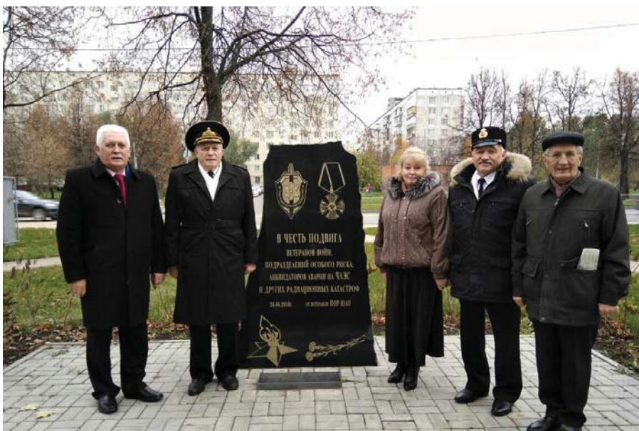
Рис. 9 Ветераны у памятника на Ореховом бульваре, г. Москва, октябрь 2017 г.