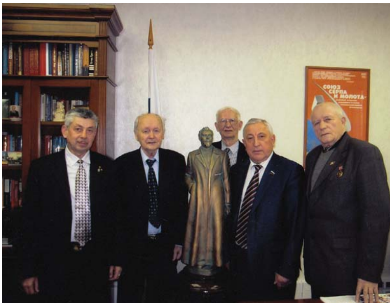
Рис. 25 Встреча ветеранов с председателем Комитета ГД РФ Н.М. Харитоновым. Москва, 2016 г.