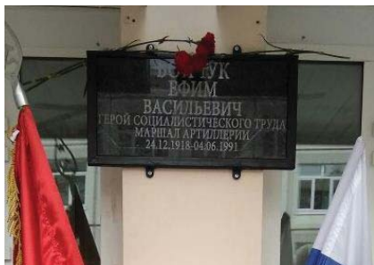
Рис. 3 Памятная доска маршалу артиллерии Е.В. Бойчуку. Школа № 2116, Москва, 2017 г.