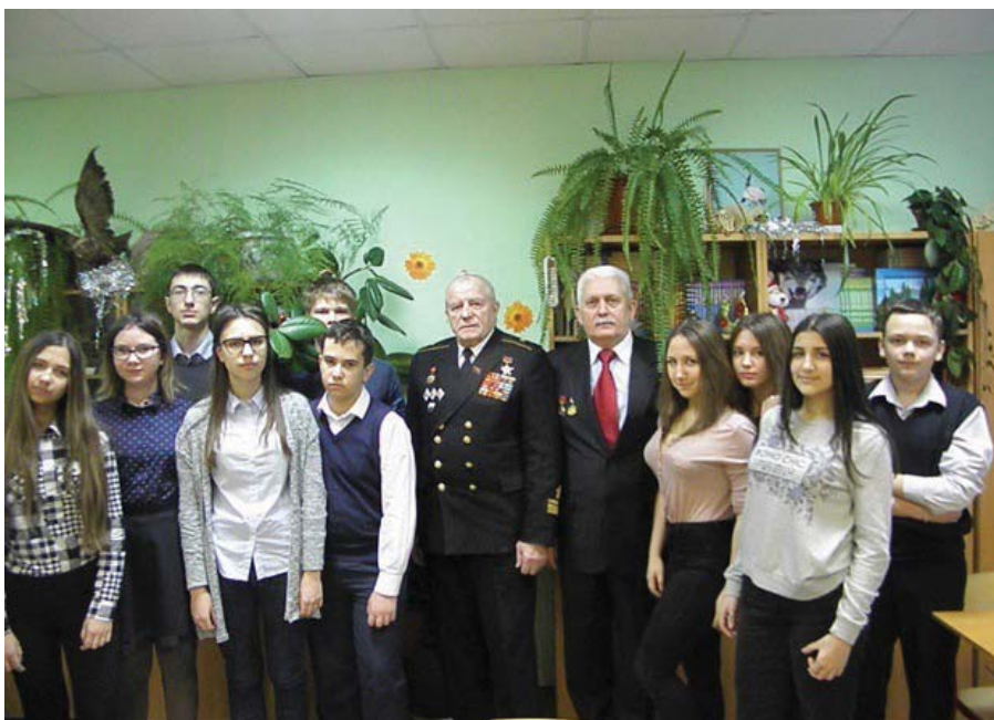
Рис. 22 Встреча ветеранов с учениками школы № 949. Москва. 2016 г.