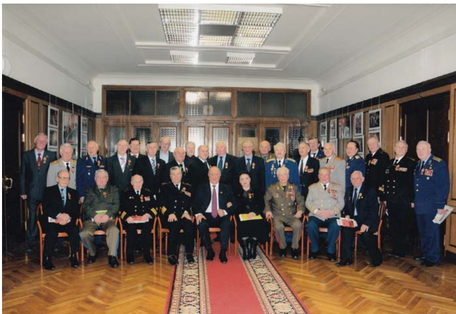
Рис. 26 Встреча с Г.А. Зюгановым. ГД РФ, май 2010 г.