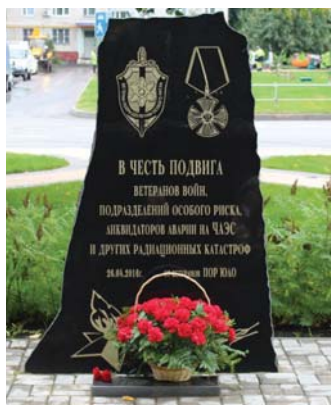
Рис. 6 Памятник Ветеранам войн, подразделений особого риска, ликвидаторам аварии на ЧАЭС. Ореховый бульвар, ЮАО, Москва, 2016 г.