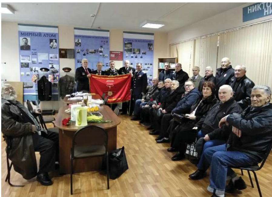
Рис. 2 Ветераны в музее «Рожденные атомной эрой». Школа № 2116, октябрь 2017 г.