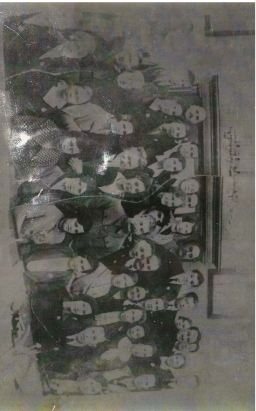
Рис. 37 И. Сталин и М. Калинин с работниками пищевой промышленности, СССР. Москва, 1936 г.