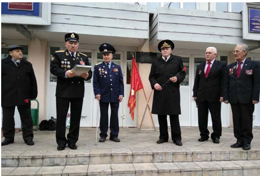
Рис. 17 Открытие памятной доски маршалу артиллерии Е.В. Бойчуку. Школа № 2116, Москва, 2017 г.