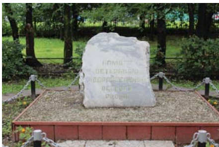
Рис. 4 Памятник Ветеранам подразделений особого риска в школе № 985. Москва, ЮАО, Зябликово, 2007 г.