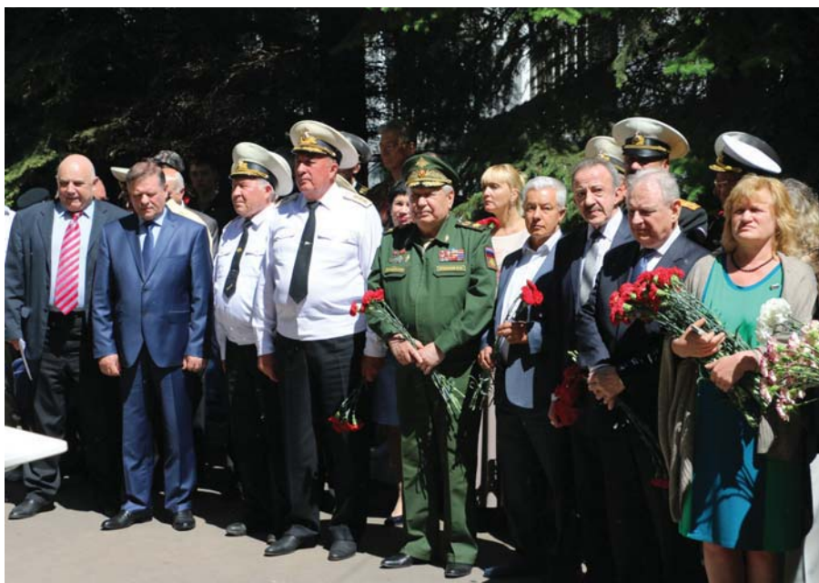
Рис. 16 На открытии памятника Н.Г. Кузнецову. В центре слева направо: адмирал И.Н. Хмельнов, генерал армии В.Ф. Ермаков. Москва, 2017 г.