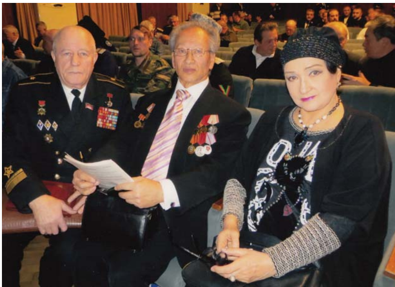
Рис. 23 С народной артисткой РСФСР З.М. Кириенко. Москва, 2016 г.