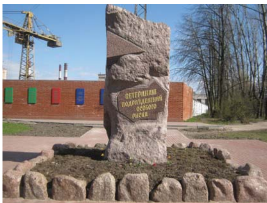
Рис. 5 Памятник Ветеранам подразделений особого риска, ул. Авто́вская-22, Санкт-Петербург, 2014 г.