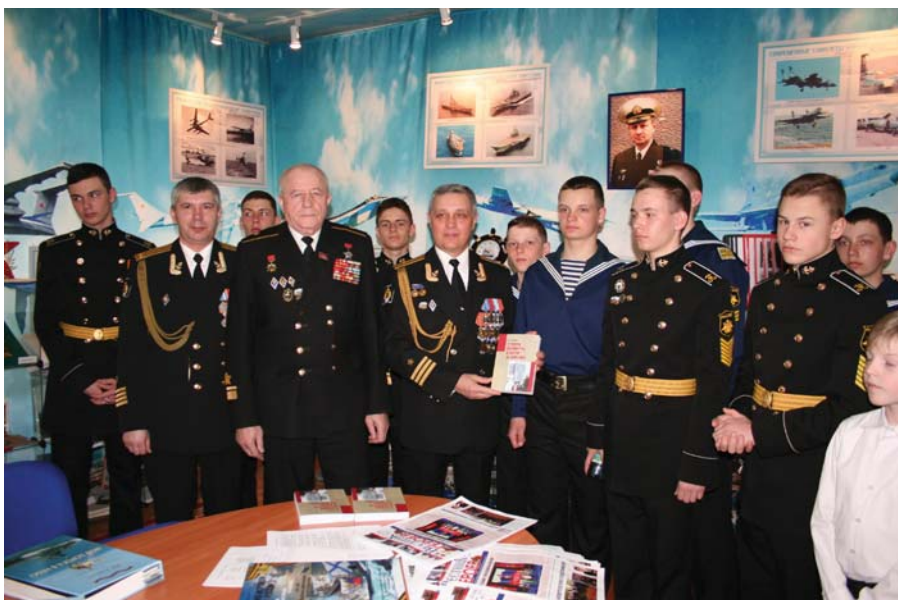
Рис. 1 В музее школы № 1383. Москва, 2016 г.