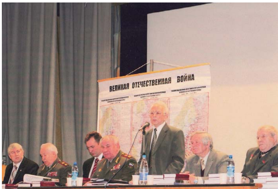
Рис. 30 Конференция в МАИ. В президиуме в центре генерал армии М. Гареев и маршал Советского Союза Д. Язов. Крайний справа В. Попович. Москва, 2005 г.