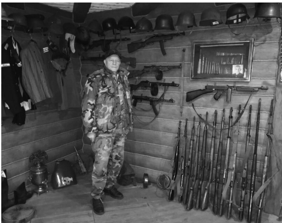
Частный музей оружия в Кубинке, Московская обл.