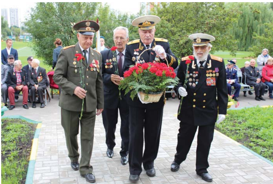
Рис. 8 Возложение цветов к памятнику в школе № 1034. 29.08.2017 г.