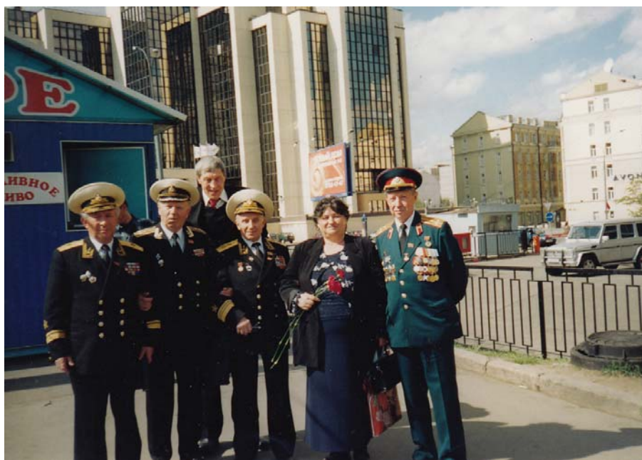
Рис. 28 Ветераны ВМФ. В центре вице-адмирал В.П. Денисов и М.И. Попович. 9 мая 2006 г.