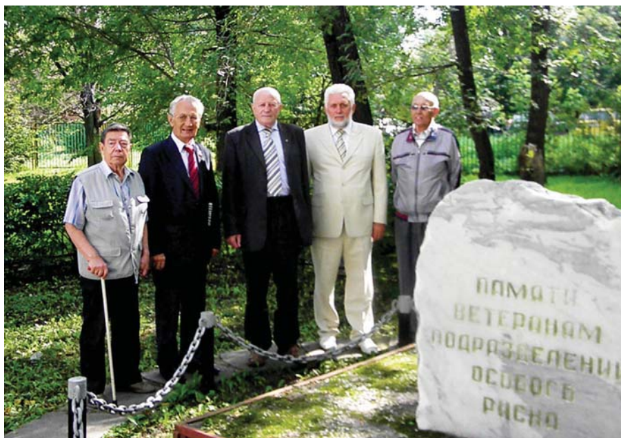
Рис. 20 У памятника ветеранам ПОР ЮАО.