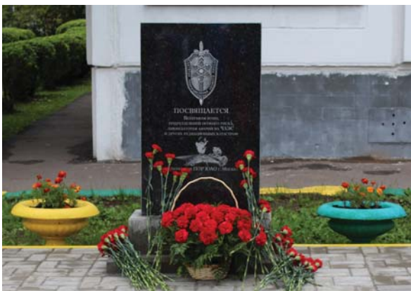
Рис. 7 Памятник Ветеранам войн, подразделений особого риска, ликвидаторам аварии на ЧАЭС. Школа №1034, Братеево, ЮАО, Москва, 2017 г.