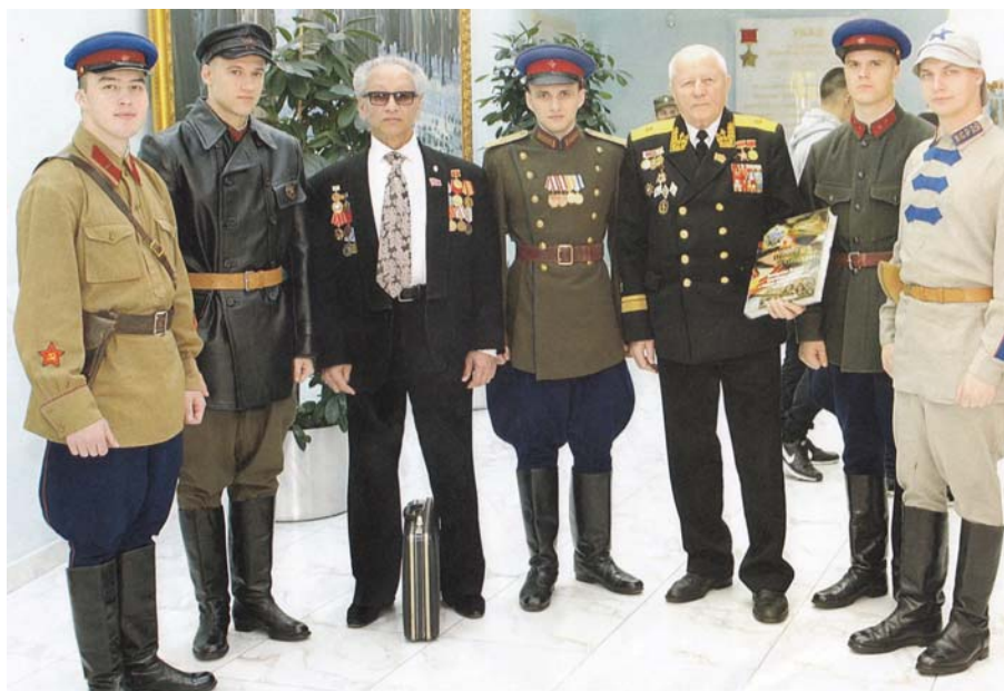
Рис. 24 На праздновании 140 - летия Ф.Э. Дзержинского. Дом ветеранов, Москва, сентябрь 2017 г.