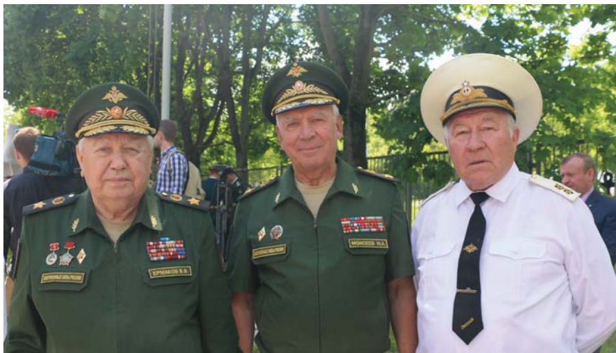
Рис. 15 На открытии памятника Н.Г. Кузнецову. Слева направо: генералы армии В.Ф. Ермаков и М.А. Моисеев. Москва, 2017 г.