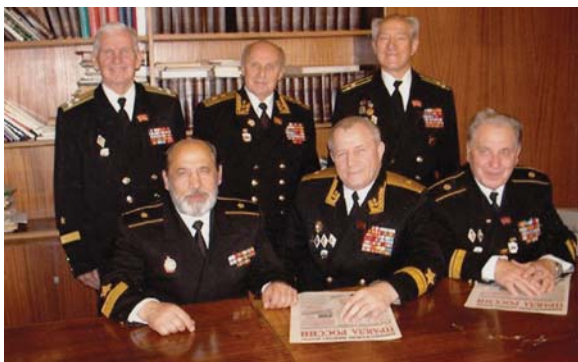
Рис. 36 В редакции газеты «Правда». Стоит в центре вице-адмирал В.П. Денисов. Москва, 2003 г.