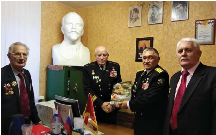
Рис. 29 В совете ветеранов ПОР ЮАО Москвы, 2017 г.