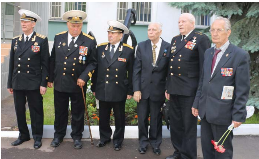
Рис. 13 Ветераны на открытии памятника Н.Г. Кузнецову. Москва, 2017 г.