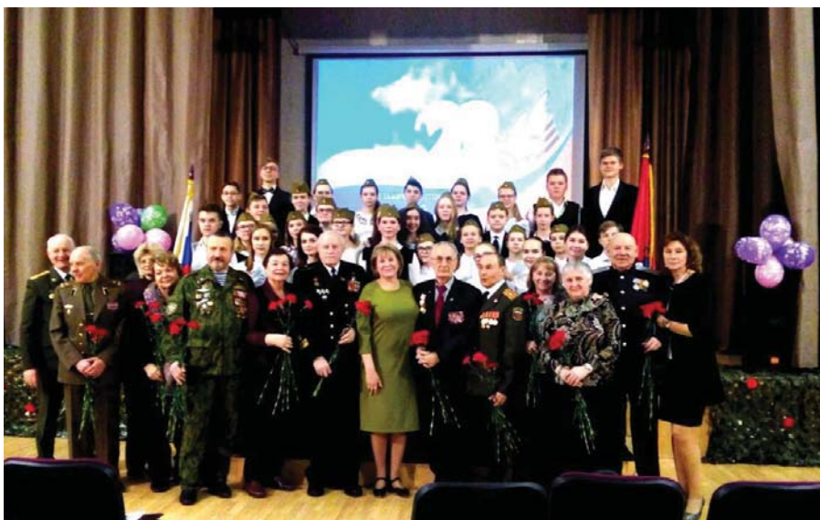
Рис. 21 Встреча ветеранов с учениками школы № 1034. Москва, 2017 г.