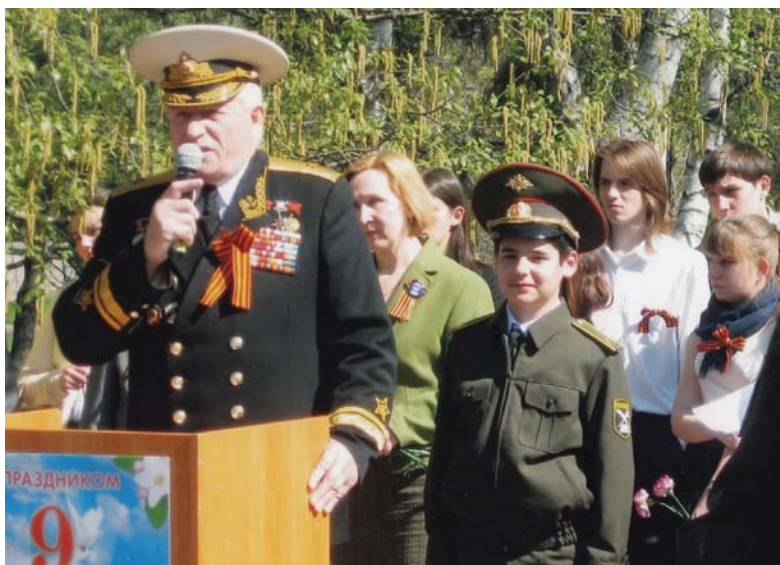
Рис. 27 Празднование Дня Победы. У памятника погибшим лётчикам. Бирюлево Западное, Москва, 2013 г.