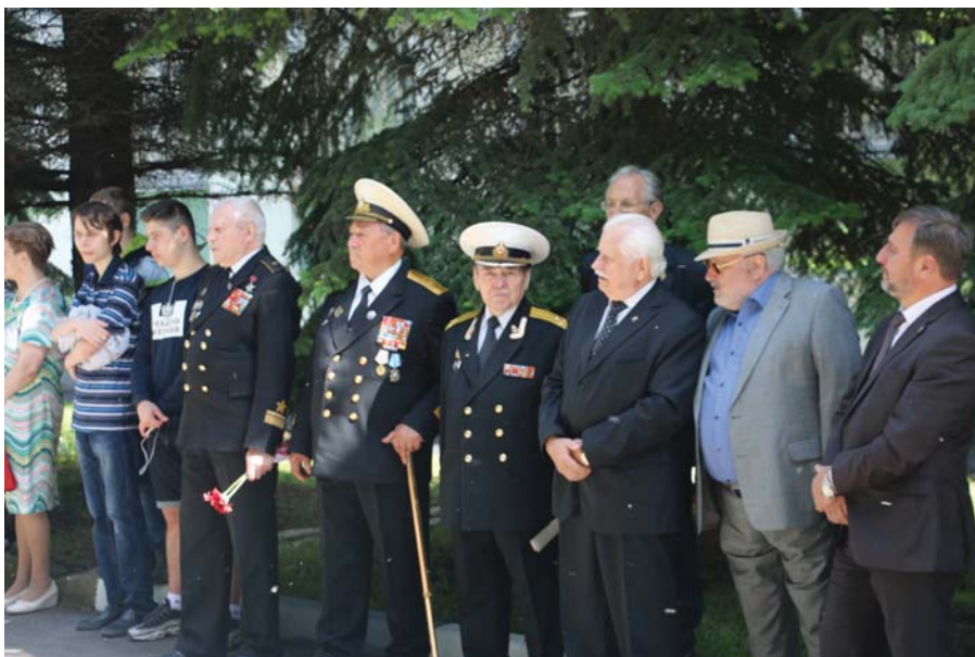
Рис. 14 Ветераны на открытии памятника Н.Г. Кузнецову. Москва, 2017 г.