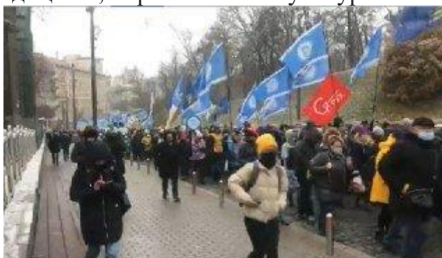
Митинг в Києве.

Кроме того, в ФПУ подчеркивают, необходимость достаточного финансирования медицины, образования и культуры.