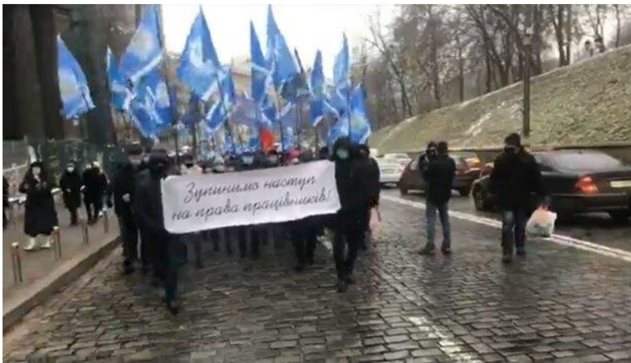
Митинг в Києве.

Кроме того, в ФПУ подчеркивают, необходимость достаточного финансирования медицины, образования и культуры.