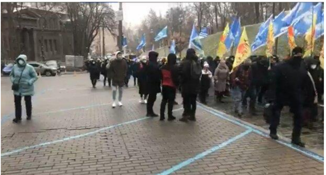
Митинг в Киеве.

В ФПУ подчеркивают, что государство во время пандемии коронавируса не должно допускать повышения цен на электроэнергию и коммунальные услуги для населения. Парламент и правительство должны сделать все необходимое для недопущения обнищания украинцев и увеличения количества бедных граждан.