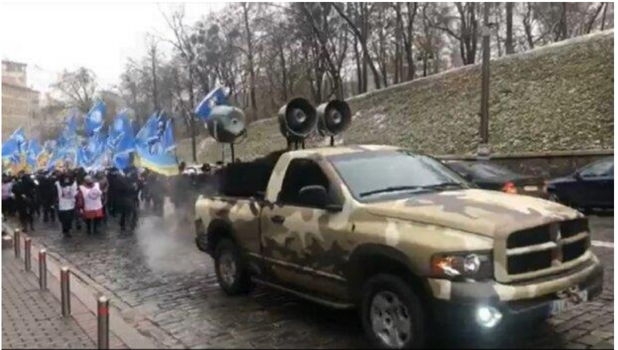
Митинг в Киеве.

Помимо этого, требованиями Федерации также является обеспечение государством средств индивидуальной защиты для каждого работника, а также бесплатное тестирование для каждого украинца.