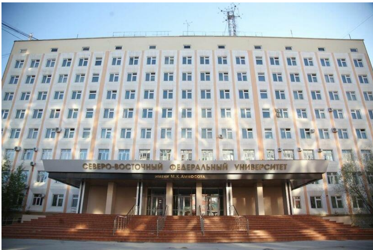
Северо-восточный федеральный университет

Гниение системы на этом не останавливается, ректор Воронежского государственного технологического университета выплачивал премии несуществующим сотрудникам, а потом забирал деньги себе.