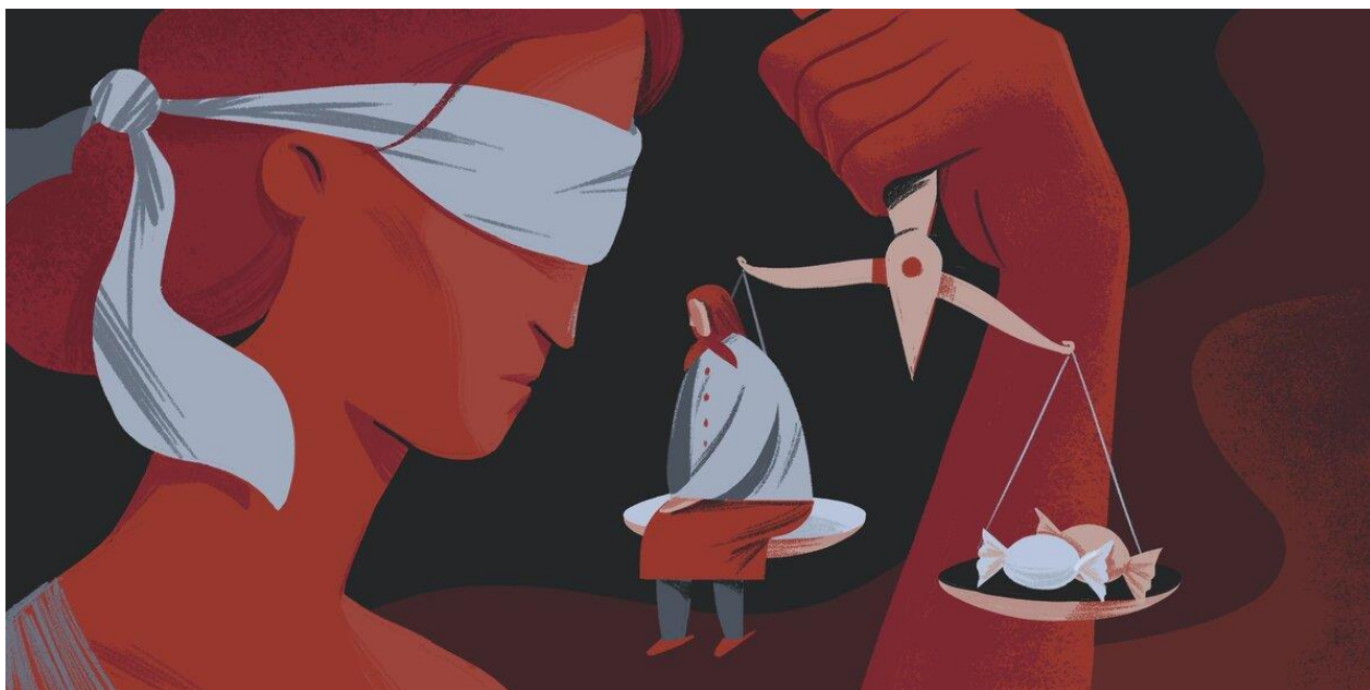
Иллюстрация: Ксения Горшкова

В Набережных Челнах 83-летняя женщина попалась на выходе из магазина с тремя пакетиками кошачьего корма. В Ухте 79-летнюю пенсионерку остановили с конфетами и десятком яиц.