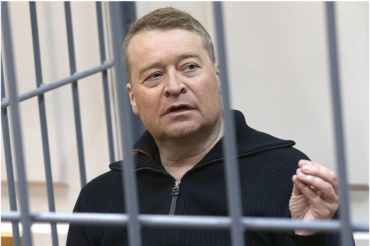
Леонид Маркелов в здании суда

И таких случаев не десятки, и даже не сотни, а тысячи. Эти люди живут на налоги честных налогоплательщиков и продолжают разворовывать страну, которая и так не отличается экономической мощью. Но глава государства не выпускает новые законопроекты, не озвучивает вознаграждения за поимку коррупционеров среди знакомых и друзей, не пытается остановить и так переходящий все границы распил бюджета. Вот почему мы с вами живем в таких условиях, и вот почему в нашей стране продолжают такие преступления.