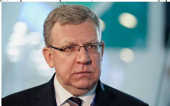
Алексей Кудрин

По текущим оценкам, минимальный спад ВВП составит 6%, отметил глава Счетной палаты. При этом после кризиса или его пика экономика России восстановится и будет «работать нормально», считает Алексей Кудрин