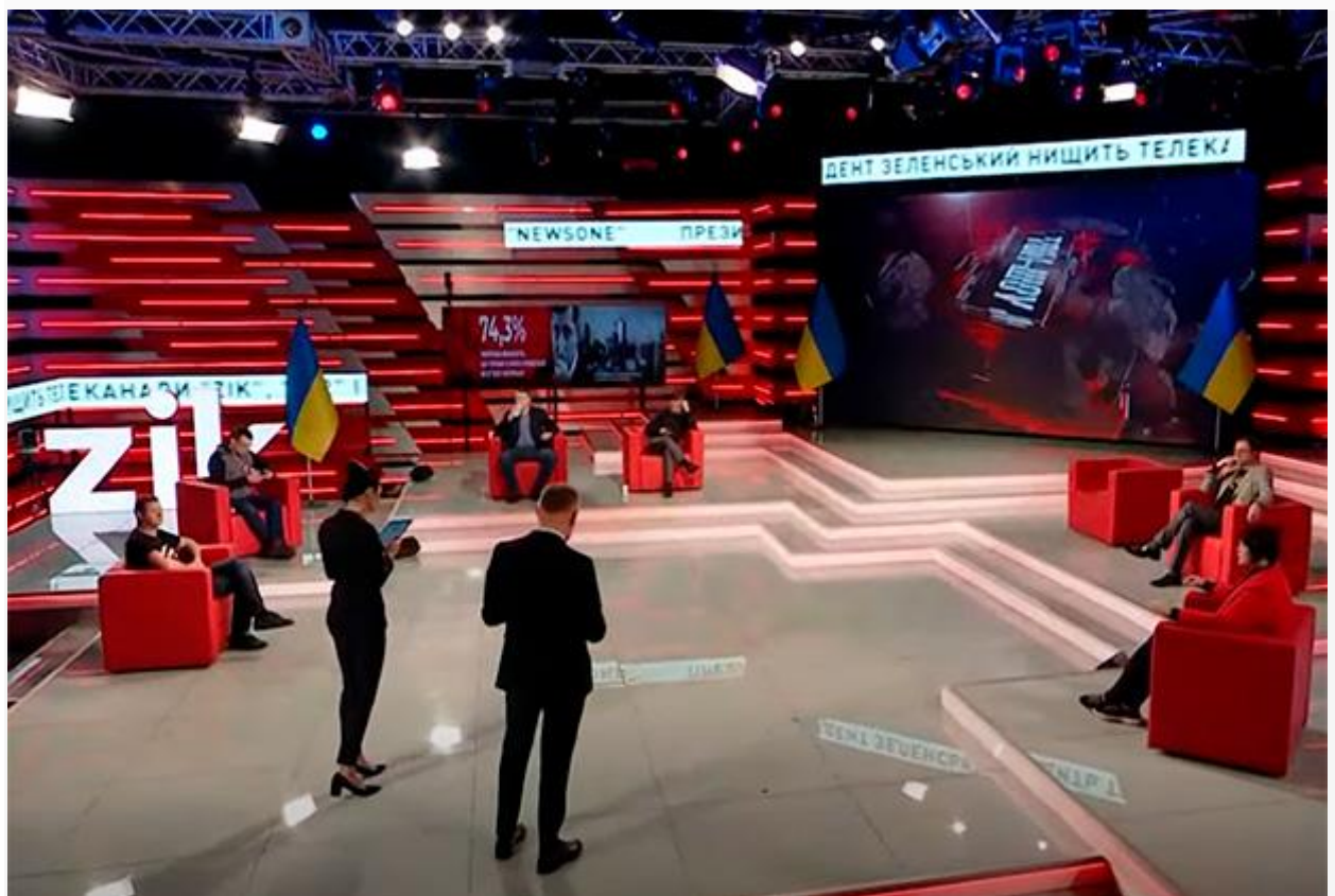
Экстренный эфир NewsOne

Это решение уже поприветствовал министр культуры и информационной политики Александр Ткаченко, назвав деятельность телеканалов терроризмом. Зеленский заявил , что принятие санкций стало трудным решением, но он не поддерживает «пропаганду, финансируемую страной-агрессором, которая подрывает Украину на пути к ЕС и евроатлантической интеграции».