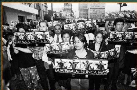
АКЦИЯ В ПАМЯТЬ ЖЕРТВ ГЕНОЦИДА В 1998 ГОДУ