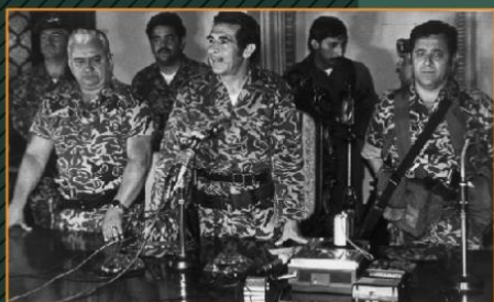
ЧЛЕНЫ ВОЕННОЙ ХУНТЫ 1982-1983 ГОДОВ, В ЦЕНТРЕ ЭФРАИН РИОС МОНТТ

Военный переворот 1982 года и захват власти в Гватемале Эфраином Риосом Монтом привели к гражданской войне. Этим воспользовались крупные землевладельцы, захватывая земли индейских общин.