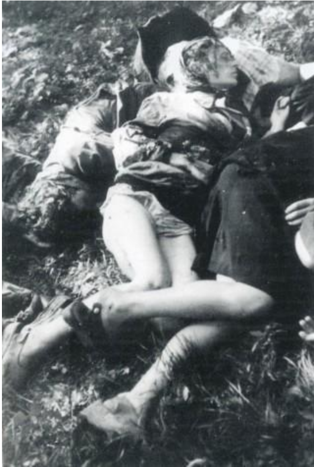
ЛЮБЫЧА КРОЛЕВСКА (LUBYCZA KRÓLEWSKA), повят Рава Руска, воеводство львовское. 16 июня 1944. Фрагмент леса – места казни. Польские женщины, убитые бандеровцами