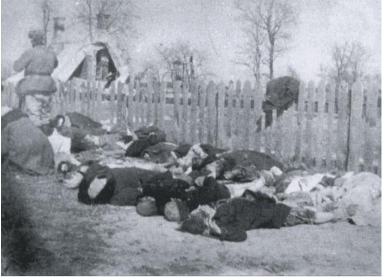
ЛИПНИКИ (LIPNIKI), уезд Костопол, воеводство луцкое. 26 марта 1943. Вид перед похоронами. Свезённые к Народному Дому польские жертвы ночной резни, совершённой ОУН - УПА.