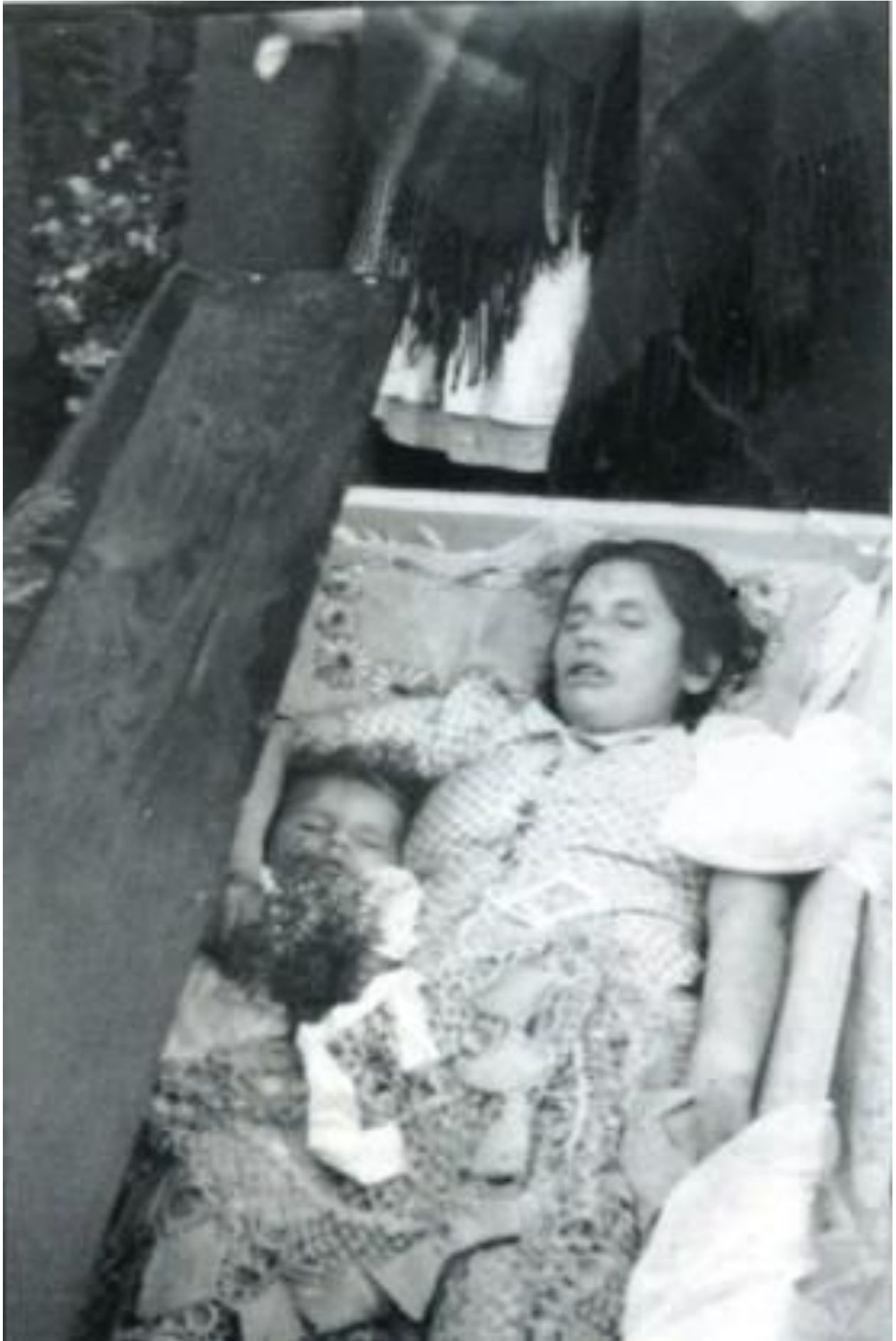
БЛОЖЕВ ГУРНА (BŁOŻEW GÓRNA), повят Добромил, воеводство львовское. 10 ноября 1943 года.