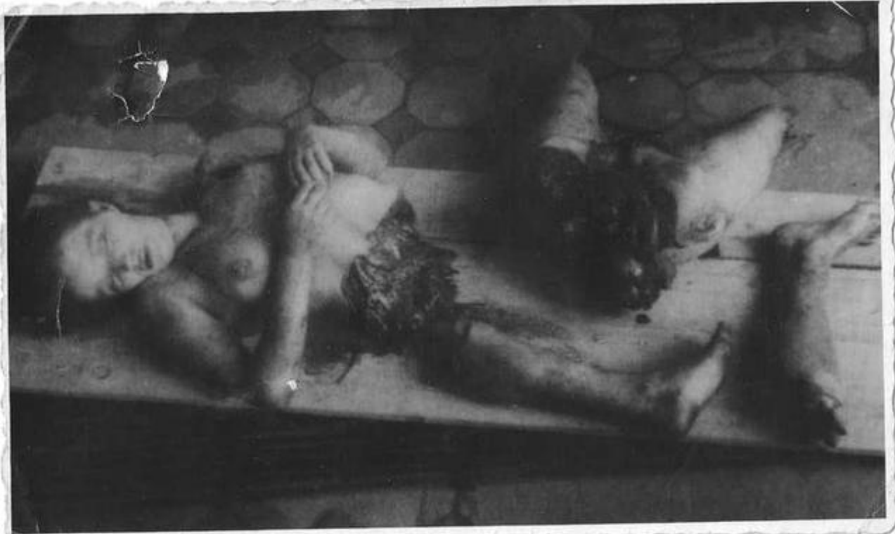
Ciało nagiej kobiety przetrźniętej piłą przez faszystów ukraińskich

Reprodukcję fotografii wykonano (zeskanowano) ze zdjęcia zakupionego w roku 1943 w województwie łwowskim, które to zdjęcie było tam w tym czasie rozpowszechniane.