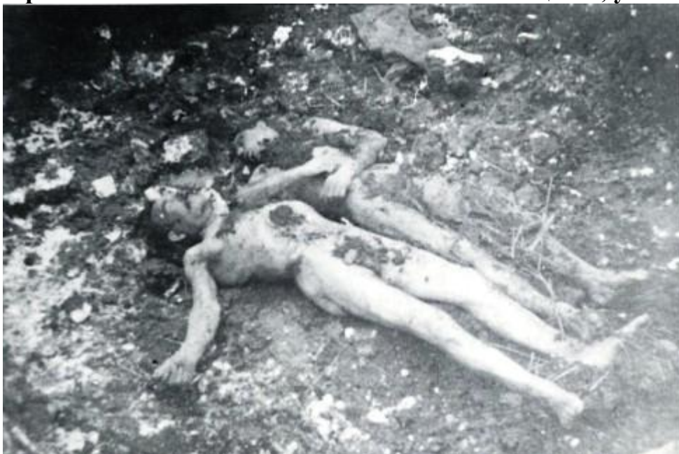
ЧОРТКОВ (CZORTKÓW), воеводство тернопольское. Две, наиболее вероятно, польские жертвы бандеровского террора. Нет более