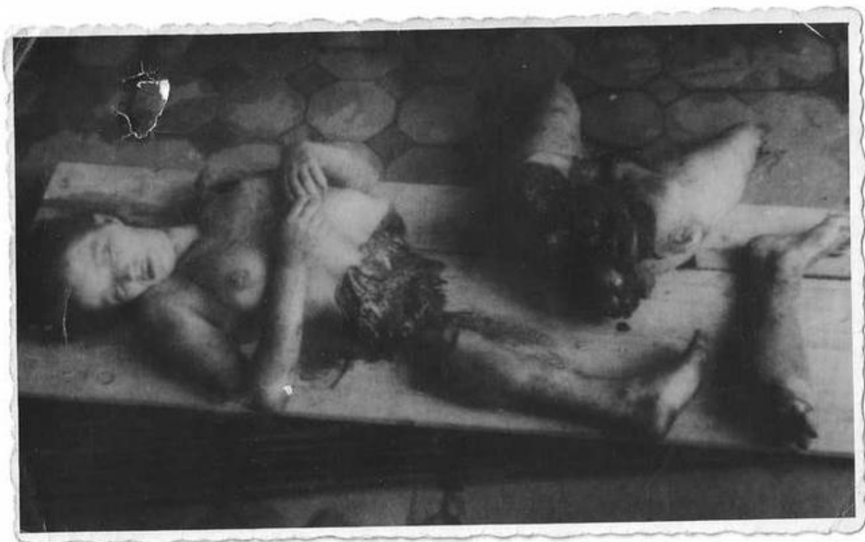
Ciało nagiej kobiety przetrniętej piłą przez faszystów ukraińskich

Reprodukcję fotografii wykonano (zeskanowano) ze zdjęcia zakupionego w roku 1943 w województwie lwowskim, które to zdjęcie było tam w tym czasie rozpowszechniane.