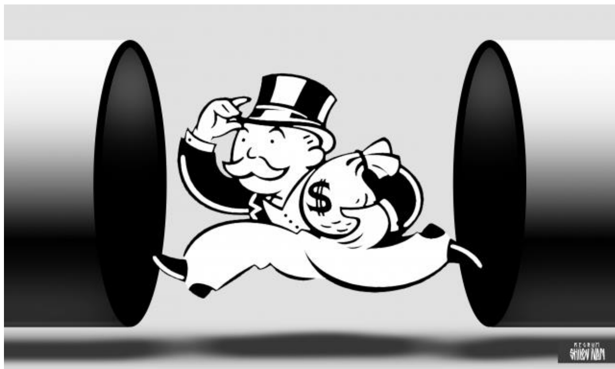
Капитализм Иван Шилов © ИА REGNUM

Капитализм — это хаотически организованная экономика, в которой субъекты хозяйственной деятельности стремятся к максимизации своих прибылей за счет эксплуатации рабочей силы и хищнического отношения к природе. Экономический хаос сопровождается экономическими кризисами, насильственно приводящими экономическую систему к балансу через разрушение производства, поглощение банкротств более крупными капиталистами. Периодически кризисы временно «разрешаются» военными действиями. Как отмечал еще Фридрих Энгельс, каждый «разрешаемый» таким образом кризис несет в себе зародыш гораздо более грандиозного будущего кризиса. К началу XX века монополистический капитализм, пришедший на смену капитализму свободной конкуренции XIX века, организовал Первую и Вторую мировые войны для военного «разрешения» глобального кризиса. При этом Вторая мировая война оказалась значительно более разрушительной, нежели первая, а третья из-за накопленного государствами ядерного потенциала может оказаться последней для человечества.