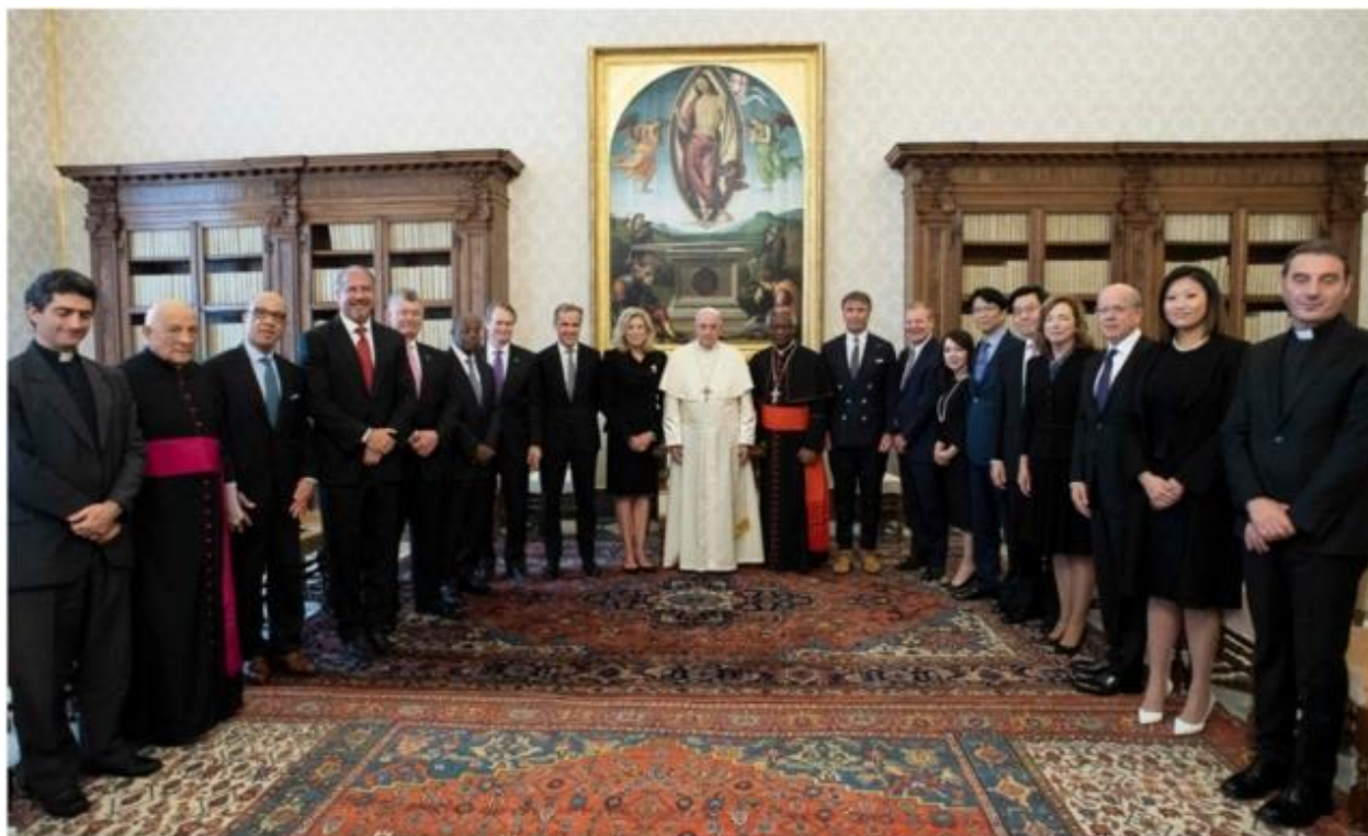
Папа Римский Франциск с членами Совета по инклюзивному капитализму