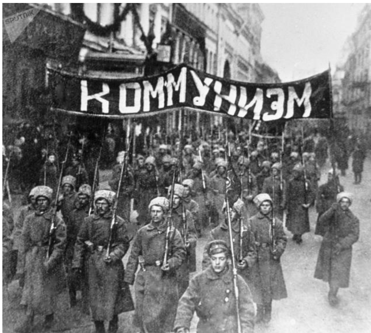
Колонна революционно настроенных солдат с лозунгом «Коммунизм» идет по Никольской улице в Москве. 1917 год

Однако такая оценка капитализма не просто противоречит заявленным самим же Советом его проблемам, как нарушение климата, кризисы в области общественного здравоохранения и социальные волнения. Совет цинично игнорирует принцип историзма, а именно трансформацию прогрессивной роли капитализма по сравнению с феодализмом в XIX веке в связи с первой промышленной революцией, связанной с применением машин, в реакционную в XX и XXI веках, связанную с большими разрушениями производительных сил в ходе мировых и локальных войн, с ростом нищеты и безработицы, ухудшением экологии. Стремясь сохранить и приумножить свою власть, Совет объединяет все активные аморальные и порочные силы для противодействия второй промышленной революции, призванной утвердить социализм для решения проблем капитализма и обеспечения всестороннего развития личности.