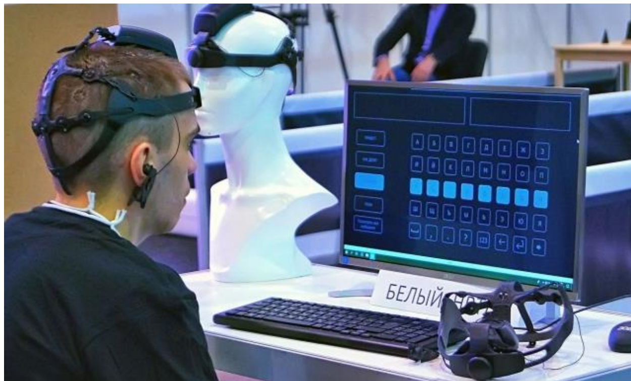
Перед экраном Mos.ru

Практическая реализация обоих проектов предполагает использование возможностей современных информационных технологий, а точнее, искусственного интеллекта (ИИ). Первый проект нуждается в создании ИИ для эффективного управления экономикой, второй — в создании ИИ для тоталитарного управления людьми.